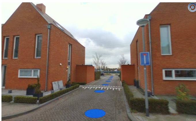
Situatie Spirealaan 67/102

Bij de uitbouw van de woningen aan de Spirealaan 67 en Spirealaan 102 is sprake van een andere stedenbouwkundige situatie. Hier is meer sprake van een visuele beëindiging door de bebouwing van de Spirealaan, uitgangspunt bij deze uitbreiding is dat er een symmetrisch profiel moest blijven bestaan. Daarnaast ligt deze bebouwing in het verlengde van een voorgevel maar is hier sprake van een achterkant/achterkant-situatie. Er is hier dan ook geen sprake van een sterk vormgeven profiel zoals in de Galigaanstraat.